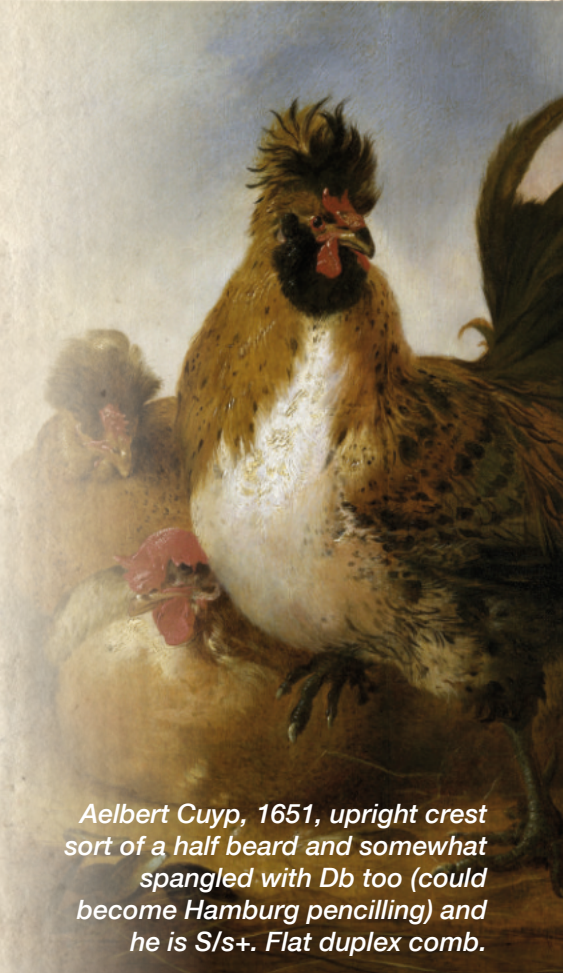
Aelbert Cuyp, 1651, upright crest sort of a half beard and somewhat spangled with Db too (could become Hamburg pencilling) and he is S/s+. Flat duplex comb.

This is a species, like the cuckoo's chick, in undeserved disregard. These London traders call them Polish, because many misrated Polish have combs (schopfen). They are smaller than some of these. But the shape of the comb as well as the proportions of the bird are different. Aldovrandi (typo in original) already claimed this. Our farm chicken, which is known to everyone, has a comb like a lark and is completely white. Another example of this variety is not a Paduan chicken. The first is of a peculiarly pointed build, leaning forward, with a moderately large, flattened, backward comb and as cute legs and feet as the Polish, the latter has a more upright posture and stockier build. I would like to distinguish the chicken with the lark's crest from the Polish in