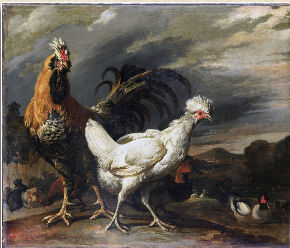
By Pieter Jansz van Ruyven 1690, a cock and hens (more in the background left). Everything is mixed, from our perspective, half beards, half crests, some white in it, mixed combs types. The reality of the 17 th century.

demselben haben. Diese vernachlässigten hühnerarten sind den wandernden federviehhändlern wohl bekannt. Von ihnen können sie leicht zu einem mässigen preise bezogen werden. Das beste ist ein Mandel zu bestellen, die besten zur zucht auszuwählen un die übrigen zu verspeisen. Diese leute taxiren die hühner nach alter, grösse und schwere. Nur dann und wann verlangen sie eine kleinigkeit mehr für einen schönen, ausgewachsenen, prunkvollen hahn, der anzeichen vom kampfhah aufweist. Aber noch besser ist es, von den frauen der kleineren pächter eier aufzukaufen, wenn sie ihren vorrath in den landstädten zu markt bringen und dann zuzusehen was dieselben wenn sie ausgebrütet sind, geben. Wenn wir zehn bis zwölf bruthennen halten und aus verschedenen gegenden eier erhalten, kann der züchter eine gute Anzahl vond verschiedenartiger kücklein erhalten un sein urtheil daran zu üben. Eine sehr kleine erfahrung wird genügen, um die herauszukennen die halbblütig sind. Dies ist eine harmlose Lotterie, bei der sicherlich einige gewinne herauskommen und nur die faulen eier Nieten sind.”